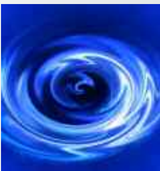
GUARNIZIONI DI TENUTA