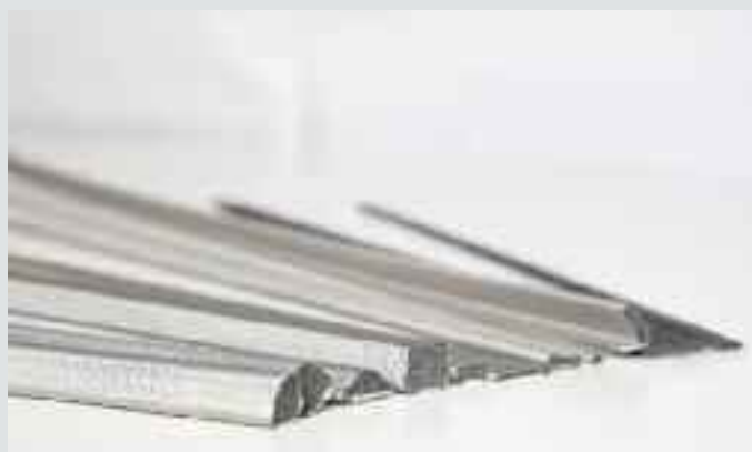
Guarnizione in tessuto conduttivo