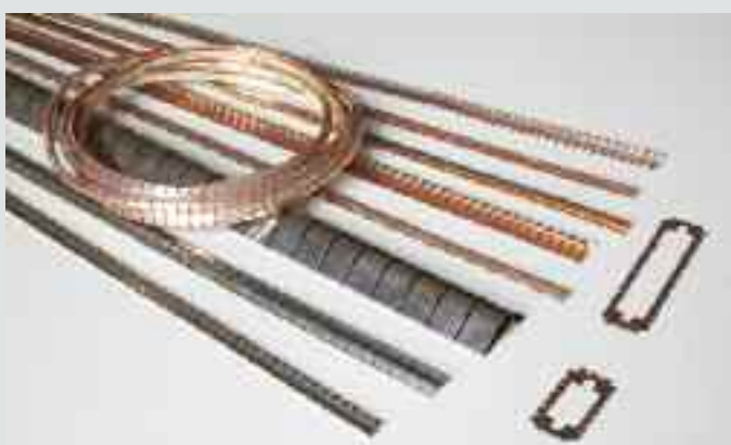
Contatti in rame berillo